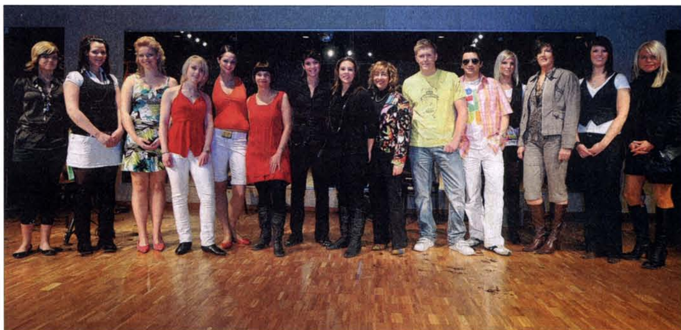
Mehr als ein Dutzend Frisöre und Modells präsentierten jetzt die aktuellen Frisuren- und make-up-Trends für den Frühling und Sommer 2008.